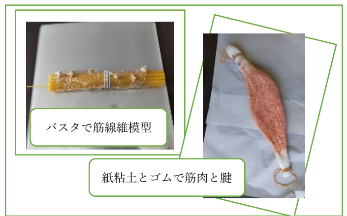
▲ 図 3 展示物の工夫 ▲

3. 実施した教員の感想：教員同士で教材を共有し、学生がいかに興味を持ってくれるか試行錯誤しながら教材準備をしている。学生が、解剖生理学で修得した知識を看護実践に活かされるか、今後の教育効果を期待している。