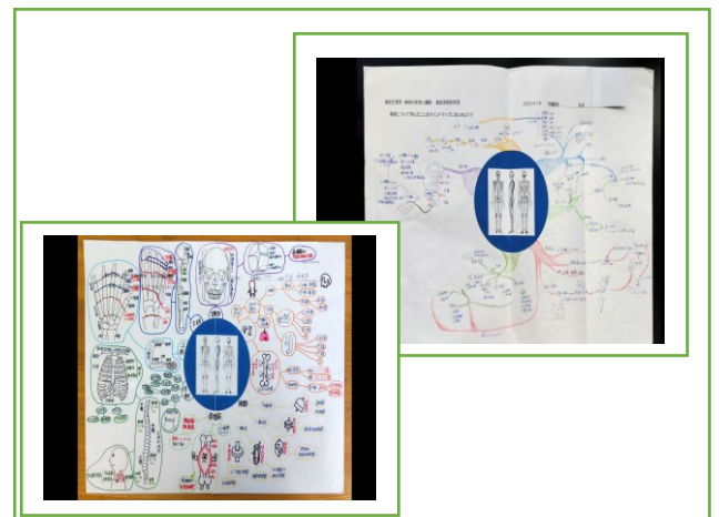
▲ 図 1 「身体の支持と運動」「血液の循環とその働き」ワークシート ▲ 図 2 「身体の支持と運動」マインドマップ